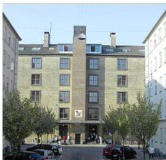
Falstersvej 3-5, 2000 F