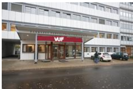
Lindevangs Allé 8-12, 2000 F

Ryging: Der må ikke ryges inden for i bygningerne! Rygere henvises til gården med indgang gennem portene, eller gennem kælderens på FA.